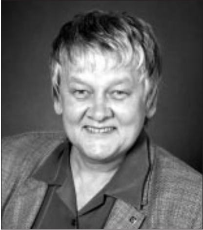
Ene Ergma, Riigikogu esimees

Viimasel ajal korraldatud kohtumistel rahvaga on olnud kõneaineks põhiseaduse muudatuse eelnõu presidendi otsevalimisteks. Kui olen inimeste arvamust selle kohta küsinud, siis vaadatakse mulle isegi veidi arusaamatu pilguga otsa, et miks ma seda üldse küsin. See on ju elementaarne, et rahvas peab valima presidendi.