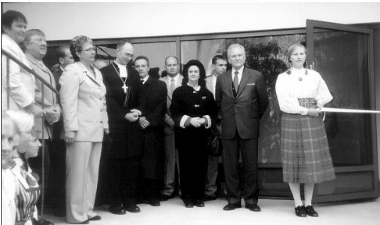
● Paistu kooli võimla avamisel oli teiste hulgas president Arnold Rüütel abikaasa Ingrid Rüütliga.