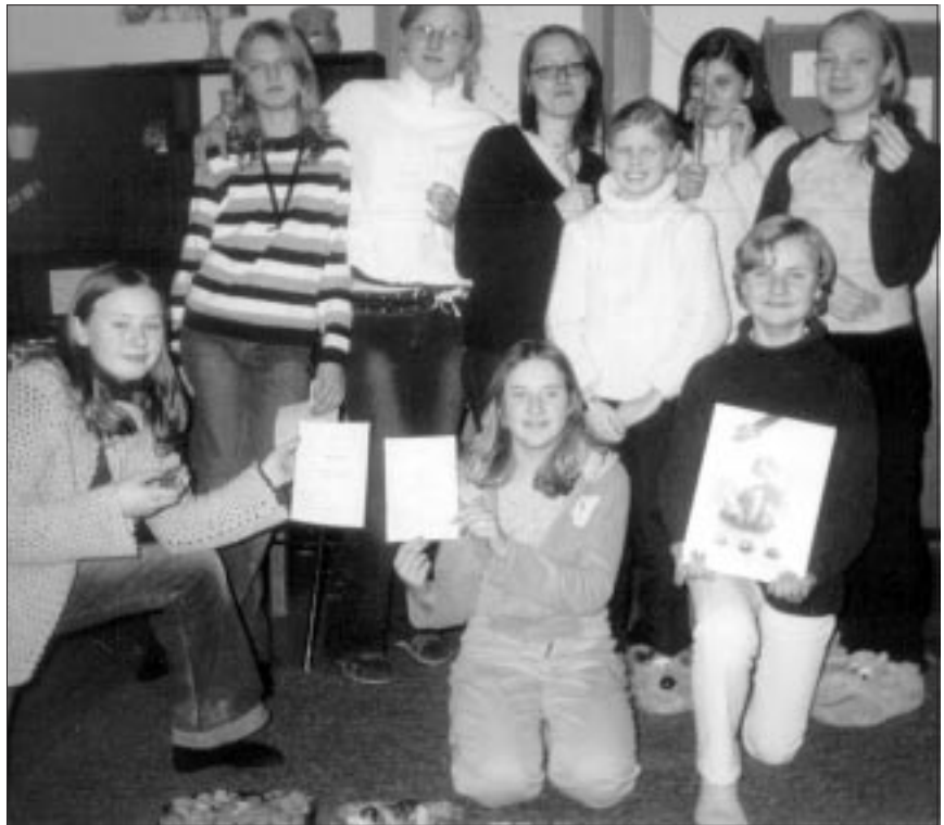
● Õpiringis "Mina ja suhted" osalejad.

Sügisel alguse saanud käelise tegevuse õpitubades said osaleda nii lapsed kui täiskasvanud. Töövahendid