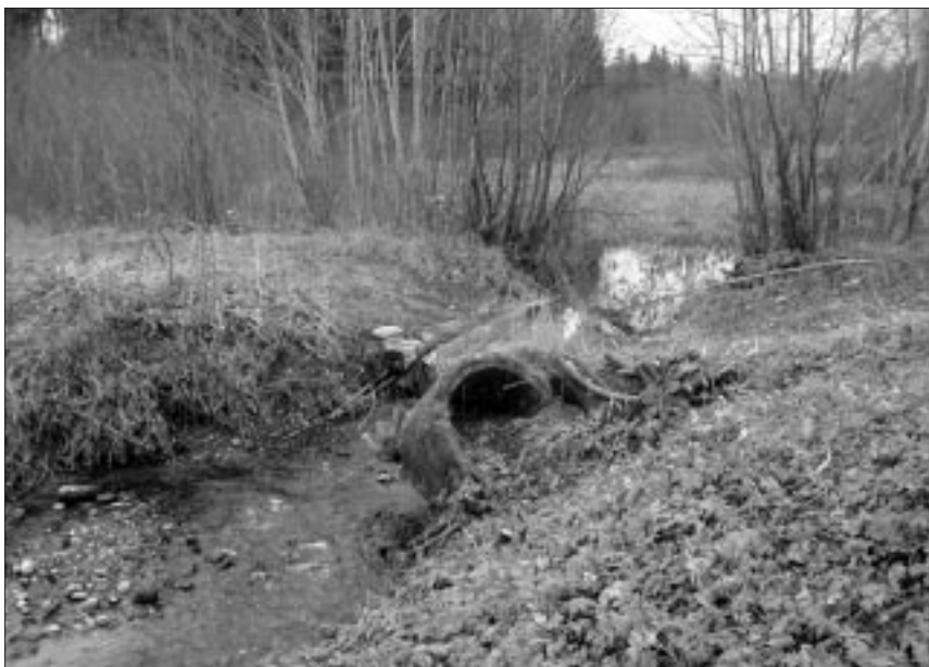
● Truubist paremale jääb 1,7 ha suurune rajatav järv koos rannaala ja puhkekohaga, praeguse truubi asemel tuleb läbipääs kaunisse orgu ja paljandi juurde sillaga.

Olulisemad keskkonna- ja veekaitsealased tegevused, millega tuleb jätkuvalt tegelda, on biotiigid, Paistu biopuhasti, Paistu küla teine suurkaev ja Sultsi veehaarde rajamise projekt. Loodi järve rahastamine ei vähenda lisavahendite hankimise võimalusi muudeks (Järg 10. lk)