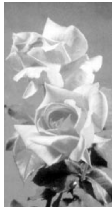
Elu on linnutiibade rutt, Elu on kohin ja muinasjutt . . .