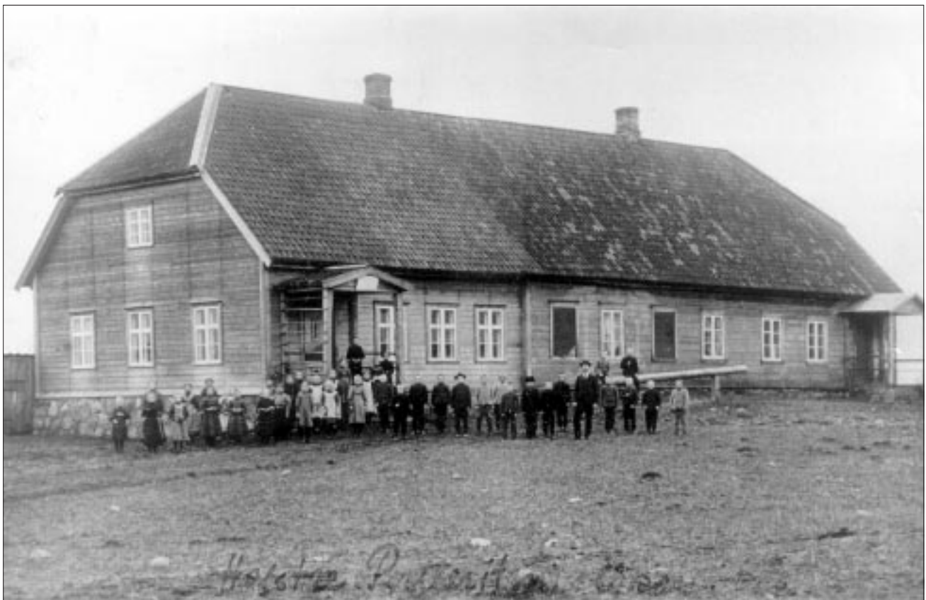
● Pulleritsu koolimaja Holstres.