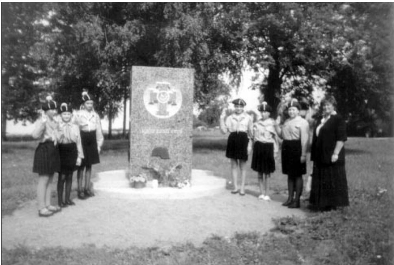
● Paistu kooli kodutütred taasiseseisvumispäeval Vabadussamba juures.