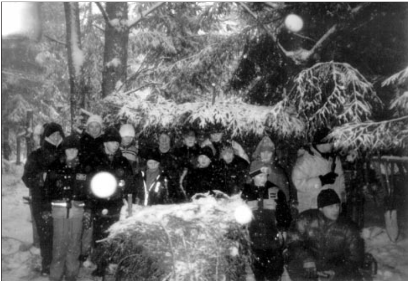
● Paistu lapsed telklaagris.